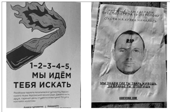
Рис. 10. Зразки залякувальних листівок: ліворуч – до військ противника (Стецюк & Любезна, 2022), праворуч – до колаборанта К. Стремоусова (В окупованому Херсоні..., 2022)

До залякувальних за змістом пропагандистських матеріалів відносимо віршовані листівки-лякалки. Їх текст базується на коротких, відомих багатьом дитячих лічилках радянського періоду. В українському перекладі вони звучать наступним чином: «Раз, два, три, чотири, п'ять зараз я іду шукать» та «Вийшов їжачок з туману. Вийняв ніжечка з карману. Буду різати, буду бити – з ким залишишся дружити?» (Стецюк & Любезна, 2022). (рисунок 10.)