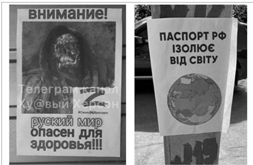
Рис. 11. Приклади попереджувальної листівки до мешканців окупованих територій Херсонщини (Воронцова, 2022; Паспорт рф., 2022)

Єднальні листівки – це ознака згуртування цивільного населення, яке перебувало в межах інтервенції російських військ, у боротьбі проти агресора. Вони підкреслювали, що мешканці українських окупованих населених пунктів не підтримують політики країни-загарбниці та ідентифікують себе українцями. Власне основними гаслами, які доносили такі агітаційні матеріали, були: «Я з Донбасу! Я українець!» (Окупанти, геть..., 2017), «Вся Луганська область – Україна!» (Активізувалися партизани..., 2022), «Крим – це Україна» (Опір у Криму..., 2019), «Російський окупант, в Стаханові тобі не раді! Це наше місто! Це Україна!» (Русский окупант..., 2022), «Мелітополь – це Україна» (В Мелітопольском районе..., 2022), «ЗСУ скоро прийдуть! Куп’янськ – це Україна!» (В окупированном городе..., 2022) тощо (рисунки 12).