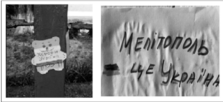
Рис. 6. Приклади рукописних листівок, які з'явилися у 2022 році на вулицях: зліва – Херсону (ЗСУ близько..., 2022) , справа – Мелітополя (В Мелітопольском районі..., 2022)

Щодо оформлення листівок, то зустрічаємо листівки як чорно-білого, так й кольорового варіантів. При цьому можна припустити, що яскрава продукція на більш якісному папері здебільшого проводилась відповідними органами української військово-політичної влади та активістами на підконтрольній офіційному Києву території нашої держави. Ймовірно, у цьому випадку використовувалась певна база видавництв, друкарень та поліграфічних компаній. А на передову лінію фронту вони постачались у готовому вигляді. У випадку так званого «кустарного виробництва» проукраїнськими активістами та партизанами на окупованих землях доводилось використовувати периферійні друкувальні пристрої – власні комп'ютерні принтера.