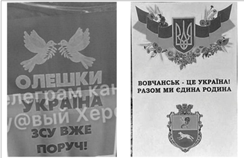
Рис. 12. Приклади єднальних листівок: ліворуч – з міста Олешки Херсонської області (В окупованих містах..., 2022), праворуч – з міста Вовчанськ Харківської області (У Вовчанську..., 2022)