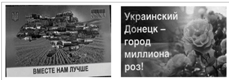
Рис. 3. Зразки листівок: ліворуч – узагальненого змісту (Над окупованим Донбасом..., 2022), праворуч – регіонального (Над Донецьком..., 2016)

Наступним питанням, на якому слід зупинитись, – це способи розповсюдження листівок. Вони, на нашу думку, напряду залежали від їх авторства. Агітація, яку виготовляли проукраїнські активісти та партизани, що перебували безпосередньо у тилу противника і діяли на окупованих територіях розклеювали листівки власноруч і, переважно, приховано, у нічний час доби (в Мелітопольском районі..., 2022).