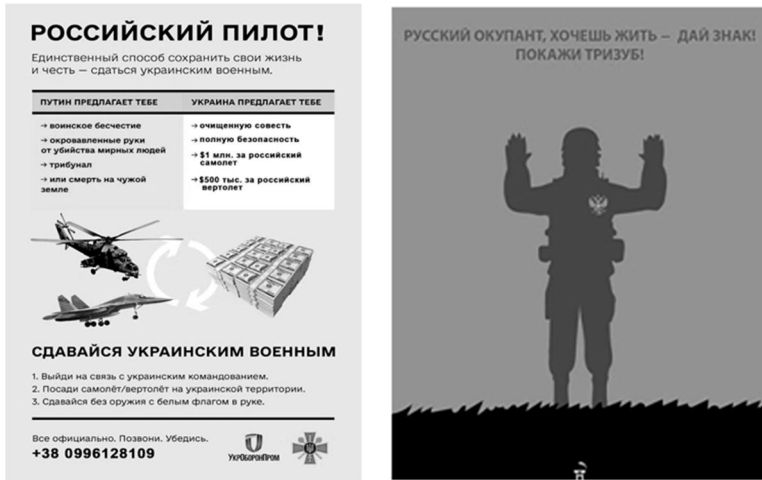
Рис. 9. Зразки листівок-роз'яснень: ліворуч – мотиваційна (Как сдаться..., 2022), праворуч – малюнкoва (Михайлова, 2022)

Листівки-роз'яснення. До цього виду агітаційних матеріалів належать: листівки щодо порядку здачі у полон (Українські військові обстрілюють..., 2022; Оккупанти масово..., 2022). Сюди ж відносимо листівки мотивуючого характеру, в яких крім процедури полонення зазначається грошова винагорода за здачу в полон з озброєнням та військовою технікою (Врятуєшся..., 2022; Как сдаться..., 2022) (рисунк 9).