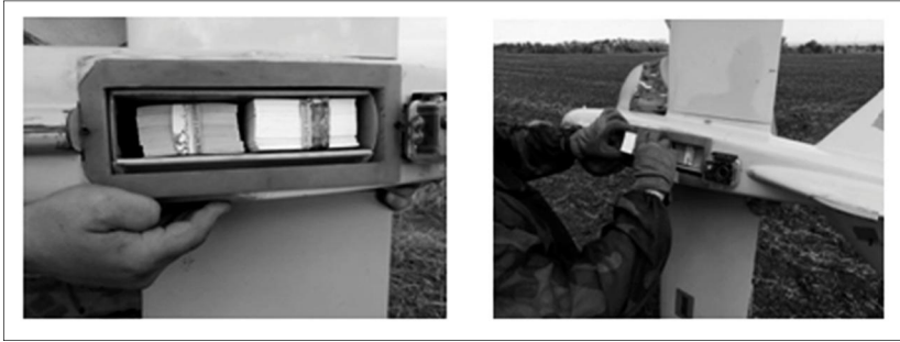
Рис. 5. Спосіб закладання листівок у БПЛА (Помни..., 2018)

відсік – спеціально для інформаційної війни» (Смешук, 2019). Цей БПЛА створений українською компанією «DeViRo» і прийнятий на озброєння Збройних Сил України в травні 2021 року (Лелека-100., 2021), але його випробовування відбувалось вже з 2017 року (Кулеш, 2017) (рисунок 5).