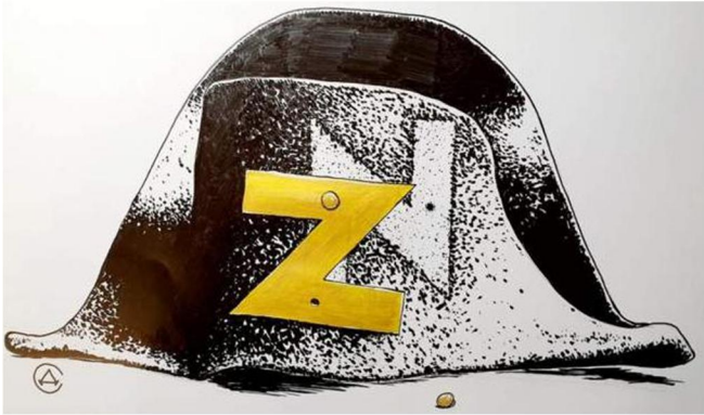
Рис. 6. Клімов А. Без назви. Перець. 2022. № 9. С. 4

Внутрішній сенс карикатури – в отождненні не лише символів, планів, а й долі Наполеона і путіна. Читача у такий спосіб підводять до логічного висновку, що як і Наполеон, який свого часу завоював значну частину Європи, спіткнувся на Росії і зазнав краху, путін неминуче програє війну з Україною.