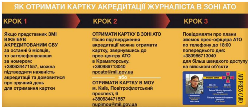
Рис. 1. Порядок отримання картки акредитації представника ЗМІ в зоні АТО

Відтак, дозволом на роботу представників ЗМІ в зоні проведення АТО стало проходження встановленим порядком попередньої акредитації у Службі безпеки України на виконання редакційних завдань в районі проведення операції та відповідна прес-карта.