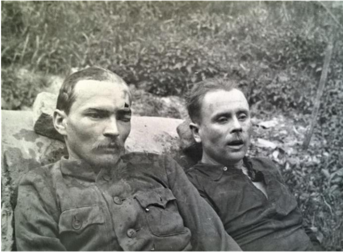
Посмертне фото. Микола Стасюк – справа, Олександр Савира – зліва

Висновки. Отже, життєвий шлях Олександра Савира був присвячений боротьбі за незалежність України. Своєї кульмінації він досяг на початку 1950-х років, охоплюючи Луччину, а також частково Володимирщину та Дубенщину. На жаль, осягнути усі аспекти діяльності цієї видатної особи в одній статті неможливо. Безперечно, біографія «Яроша» заслуговує подальшого вивчення. Вона має дослідницьку перспективу навіть у форматі окремої монографії.