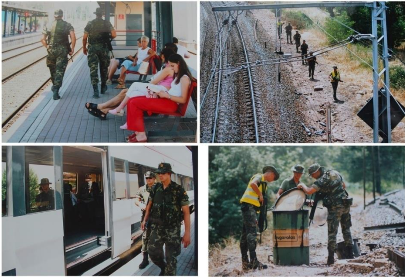
Рис.1. Військовослужбовці 12-го кавалерійського розвідувального полку «Фарнезіо» під час патрулювання залізничних шляхів і вокзалів у провінціях Авіла, Сеговія, Мадрид і Сьудад-Реаль.

28 травня 2004 року було створено Національний анти-терористичний координаційний центр (ісп.: Centro Nacional de Coordinación Antiterrorista; далі – CNCA) зі штаб-квартирою на околиці Мадрида. Штат CNCA налічував близько 60 осіб, половину штату складали аналітики з Національної поліції та Цивільної гвардії, які працювали разом з представниками розвідки CNI з МО Іспанії. Центр координував операції та обмін інформацією з іноземними розвідувальними агентствами Великої Британії, США, Нідерландів, Франції, ФРН, країн Африки (Celaya, 2009: 24). Створення CNCA стало значним кроком вперед, як з точки зору інтегрованого розвідувального аналізу – ключового інструменту, що дозволив уряду приймати зважені рішення щодо політики безпеки. CNCA організував створення єдиної бази даних, яка забезпечувала швидкий доступ усіх правоохоронних структур до інформації щодо тероризму. Ця система повноцінно запрацювала у 2006 році і об'єднала паспортні дані, облікові записи щодо зброї та вибухових речовин, списки пасажирів, а також каталог записів голосів і відбитків пальців. Після ратифікації закону Ley Organica 10/2007 до цього списку були