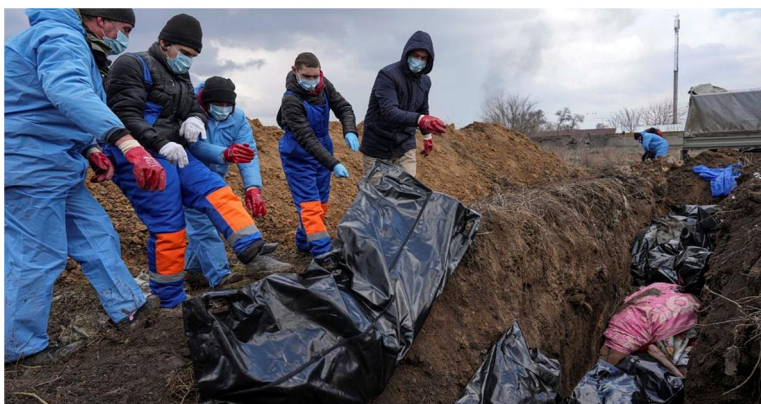
Рис. 4. Поховання загиблих у Маріуполі, 9 березня 2022 року.

Після повного оточення міста інтенсивність обстрілів і ракетно-бомбових ударів значно посилилась, відтепер жодний район у місті не був безпечним. Для артилерійських обстрілів росіяни розгорнули у районах населених пунктів Мангуш та Лебединське до трьох батарей САУ та до двох батарей РСЗВ ( Рік незламності: крах операції "Z": монографія, 2023: 215 – 216 ). Значно зросла кількість загиблих серед цивільного населення. Як згадував Єлизар Гранков, лікар-анестезіолог обласної лікарні інтенсивного лікування: «Я пам'ятаю день, коли в нас лише у нейрохірургії було 10 операцій. І ще операцій 10 – 20 у травматології та хірургії. Оперували всюди, вдень і вночі. Серед поранених, яких нам привозили, звісно, були військові, але на кожного припадало 30–40 цивільних» (86 днів Маріуполя. Літопис оборони, 2024 ).