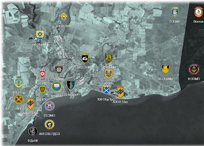
Рис. 1. Загальна схема розташування Сил оборони України в Маріуполі станом на 24 лютого 2022 р.

Захищали місто десятки різних підрозділів – ЗСУ, НГУ, МВС, СБУ, ДПСУ. Їхню чисельність на момент вторгнення підрахувати неможливо через недоступність джерел. Але на основі відкритої інформації можна зробити висновок, що через бої в Маріуполі пройшло від 5 – до 8 тисяч особового складу. Їх основу склали: 12-та бригада оперативного призначення імені Дмитра Вишневецького Національної гвардії України та окремий загін спеціального призначення «Азов»; 36-та окрема бригада морської піхоти імені контрадмірала Михайла Білинського та додані батальйони морської піхоти (501-й та 503-й); 109-та окрема бригада територіальної оборони; Донецький прикордонний загін та інші. Серед сил противника варто відзначити: 150-ту мотострілецьку Ідрицько-Берлінську дивізію; 810-ту окрему бригаду морської піхоти Чорноморського флоту; 19-ту Воронежсько-Шумленську мотострілецьку дивізію; 155-ту окрему бригаду морської піхоти Тихоокеанського флоту; спеціальний загін швидкого реагування «Ахмат»; окремих штурмовий батальйон «Сомалі» та інші. Загалом чисельність ворога, за різними даними, складала щонайменше 15 тисяч. До того ж він мав значну перевагу в озброєнні та військовій техніці, а у повітрі та на морі – тотальну (86 днів Маріуполя. Літопис оборони, 2024).