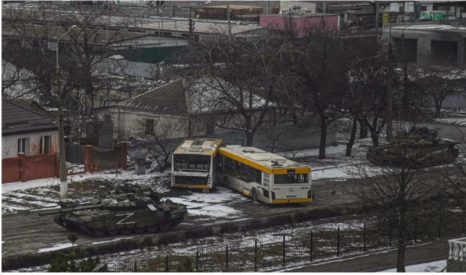
Рис. 3. Перекриття однієї з вулиць комунальними автобусами Джерело: "Доводилось їти з автоматом на танк" – морпіх Руссу про оборону Маріуполя. (2022). Суспільні новини.

URL: https://suspilne.media/299134-dovodilos-iti-z-avtomatom-na-tank-morpih-russu-pro-oboronu-mariupola/ (дата звернення: 22.08.2024).